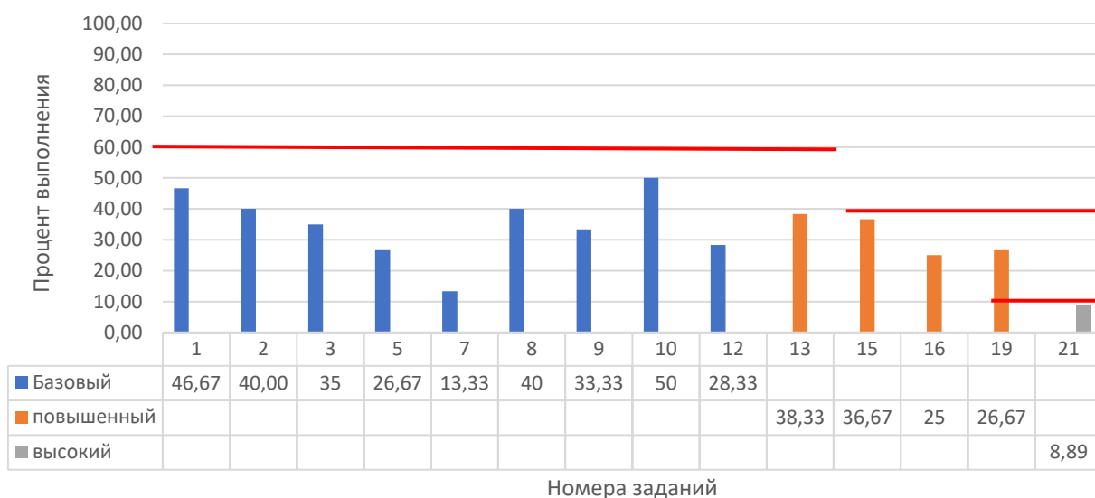
Рисунок 2. Задания, по которым участники не преодолели минимальный порог

Анализ результатов участников и типов заданий, попавших в перечень (табл. 2, рис. 2), выявил следующие частые затруднения участников экзамена: